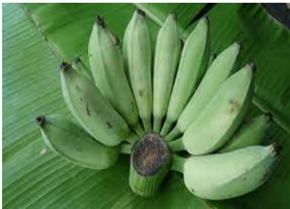
กล้วยดิบ