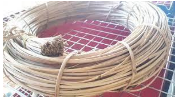
หวายเส้น