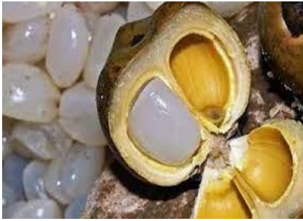
ลูกตาว/ลูกตาว/ลูกชิต