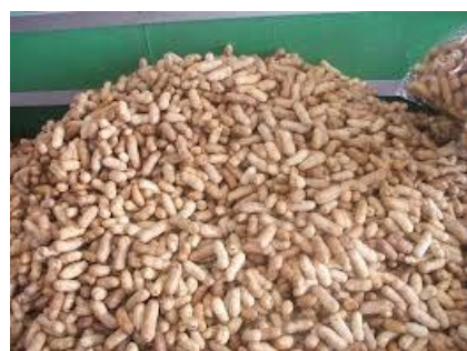
ถั่วลิสงทั้งเปลือก