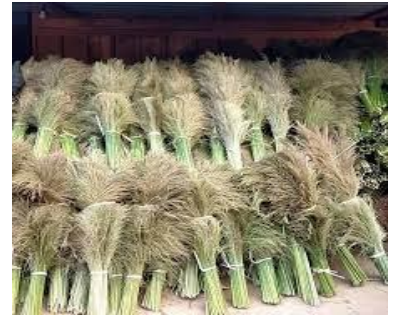
แฉม (ดอกหญ้าไม้กวาด)