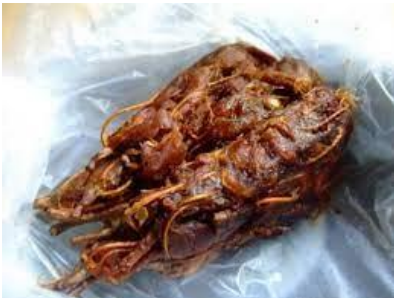
มะขามเปียก