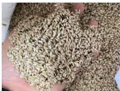
เมล็ดหัวรูชี้