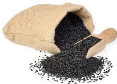
เมล็ดงาดิบ