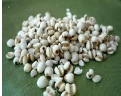
ลูกเดือย